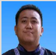
JONNYER JUHATI PEMBANTU AWAM H.11