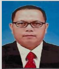
MASSILIN @ MASILIN PENOLONG PEGAWAI PENGUATKUASA KP.29