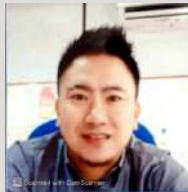
MARK WOLD LADIH PEN.PEG.KESIHATAN PERSEKITARAN U.29