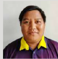
JR ALBERIONE PEMBANTU AWAM H.11