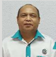
YANGUN DIGANG JURUTEKNIK J.19