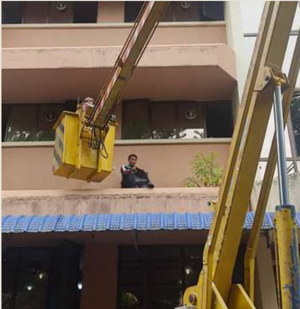
Recording a Vlog

Pembersihan di bahagian jendela bangunan Pejabat Kompleks digunakan "Crane Truck" bagi memudahkan pembersihan di paras bangunan yang tinggi.