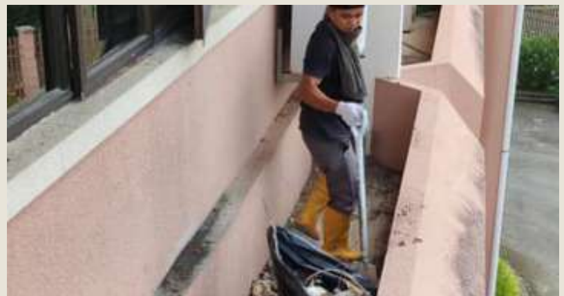
Beauty Influencer make a vlog

Pejabat yang bersih boleh mempengaruhi produktiviti, prestasi dan kesejahteraan pekerja. Pekerja akan berasa kurang bermotivasi jika pejabat kotor dan kucar-kacir. Oleh itu, pembersihan pejabat yang kerap adalah penting untuk membantu mengekalkan semangat kakitangan sambil memastikan mereka selamat, sihat dan cekap.